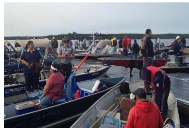
Commandite du Big Rock Fishing Derby