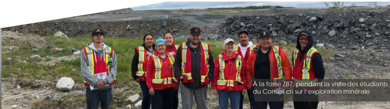
A la fosse Z87, pendant la visite des étudiants du Conseil cri sur l'exploration minière