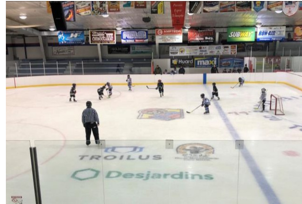
Commandite du tournoi de hockey Chibougamau peewee