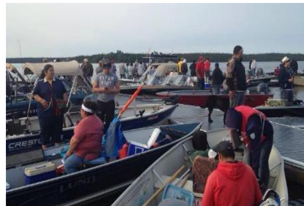
Commandite du Big Rock Fishing Derby