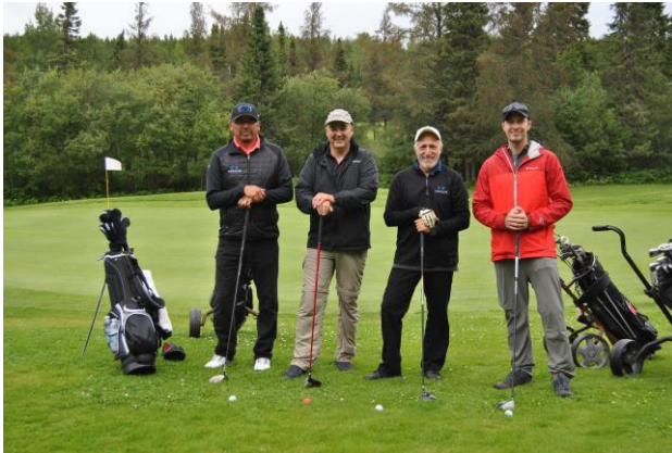
Principal commanditaire du tournoi de golf Centraide de Chibougamau

Troilus est fière de participer à ses collectivités locales par le parrainage d'activités et d'événements pour les jeunes, qui visent la promotion de styles de vie sains, de la culture, de l'engagement social et de l'éducation.