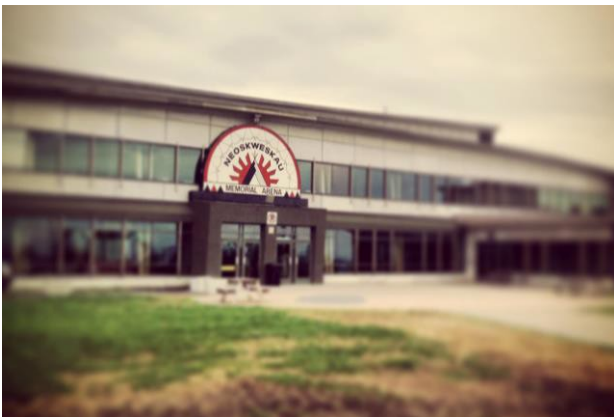
Commandite annuelle des programmes sportifs et récréatifs de Mistissini